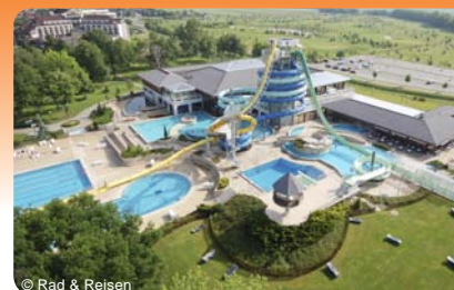
På cykeltur i Slovenien